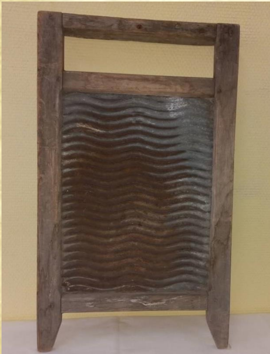
Фото. Стиральная доска – экспонат музейной-студии

Стиральная доска — приспособление для ручной стирки, представляющее собой ребристую поверхность, о которую следует интенсивно тереть намоченную в мыльном растворе одежду с целью обеспечить более эффективное проникновение частиц моющего средства в поверхностный слой ткани и последующее удаление частиц грязи.