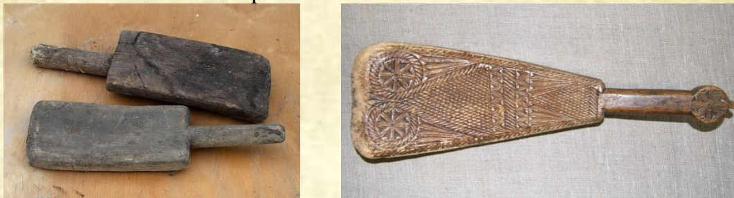
Фото. Валеk из интернет ресурса

Еще одним орудием для стирки служил ВАЛЕК. Этой небольшой деревянной лопаткой «валяли» или «клепали» выстиранное белье на камне или на доске на берегу. Если ни ступа, ни корыто, ни лохань обычно красотой не отличались, то вальки могли украшаться затейливыми орнаментами.